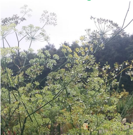
Venkel in de regen 😊

De Theetuin Uniek Leven & de Kruidenreus zijn open van donderdag tot en met zondag.